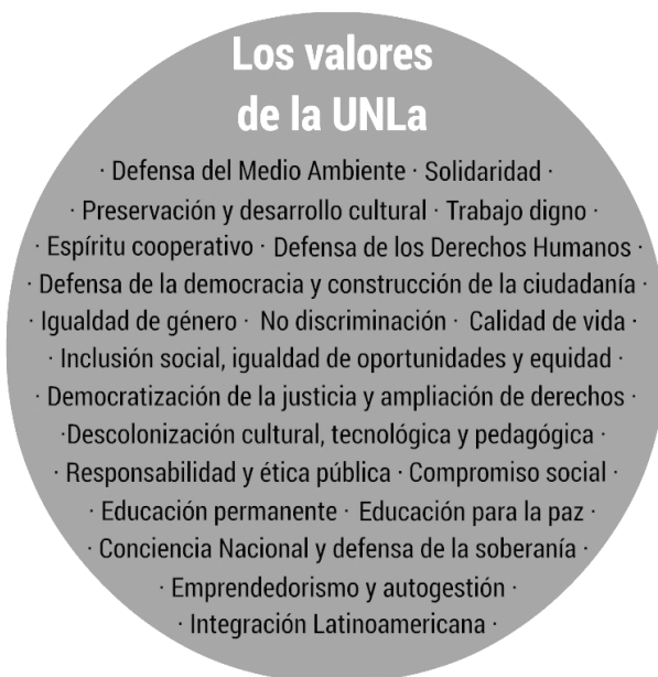
Ilustración 1: Los valores de la UNLa.